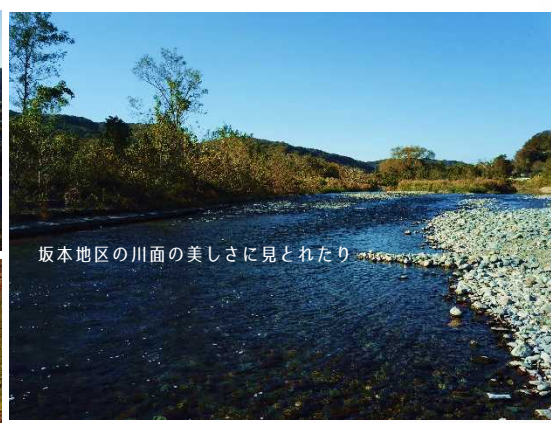
坂本地区の川面の美しさにとれたり