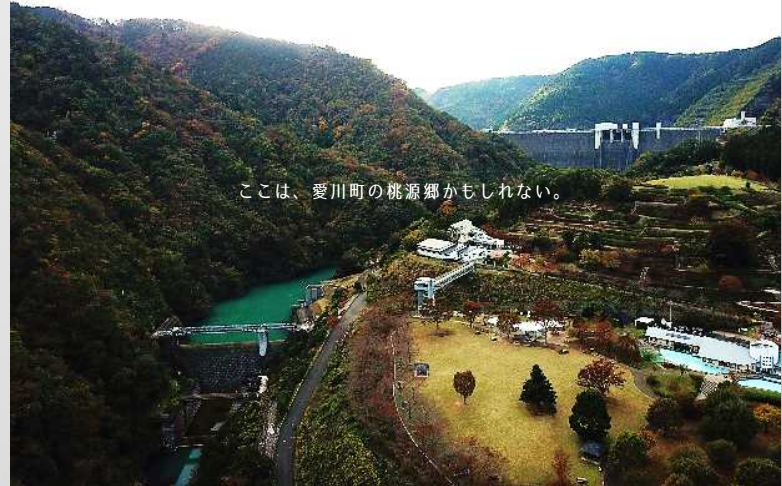
ここは、愛川町の桃源郷かもしれない。