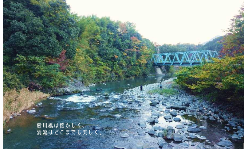
愛川橋は懐かしく、 清流はどこまでも美しく。

丹沢山系の奥深く その源を発する中津川は 宮ヶ瀬湖を経て、愛川町のほぼ中央を流れゆく もうずっと 人々の営みを、暮らしを支えつづけるこの清流は きっと、心のふるさとであるに違いない