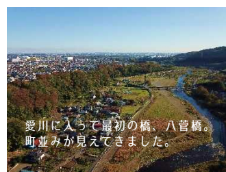
愛川に入って最初の橋、八管橋。町並みが見えてきました。