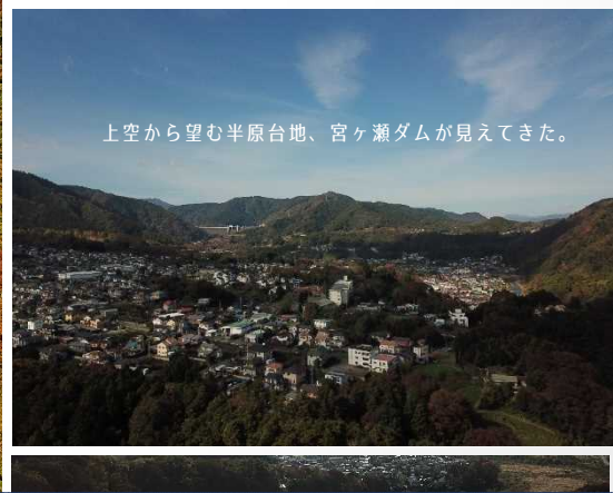
上空から望む半原台地、宮ヶ瀬ダムが見えてきた。