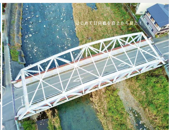
はじめて日向橋を真上から見た！