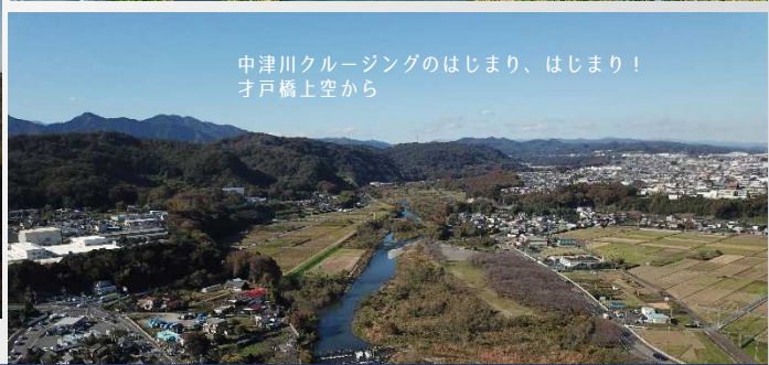
中津川クルージングのはじまり、はじまり！ オウ橋上空から

丹沢山系の奥深く その源を発する中津川は 宮ヶ瀬湖を経て、愛川町のほぼ中央を流れゆく もうずっと 人々の営みを、暮らしを支えつづけるこの清流は きっと、心のふるさとであるに違いない