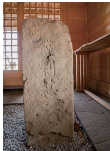
浅利明神内にある曾雌知義が建立した浅利信種の墓碑