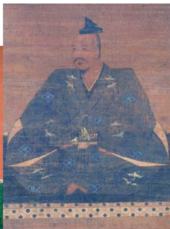
高野山持明院蔵 武田(晴信)信玄像