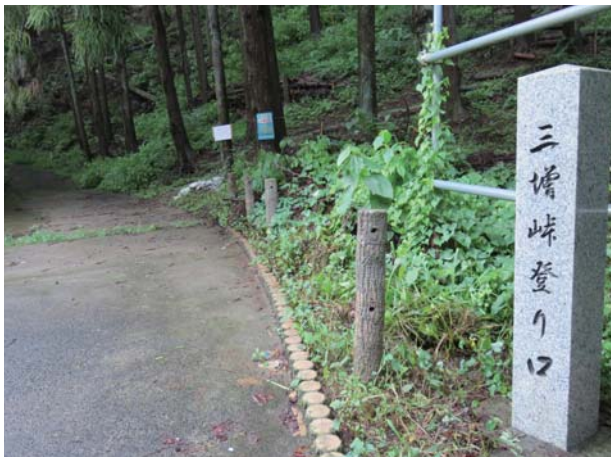
合戦の舞台となった三増峠の登り口