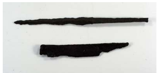
昭和33年に金山原で発見の槍の穂先と折れた刀