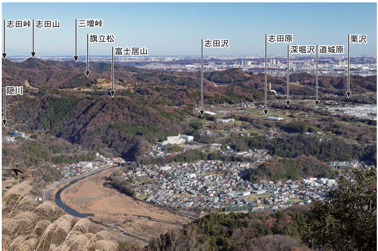
三増合戦場跡遠望（経ヶ岳中腹の林道より撮影。手前は田代地区の住宅街）