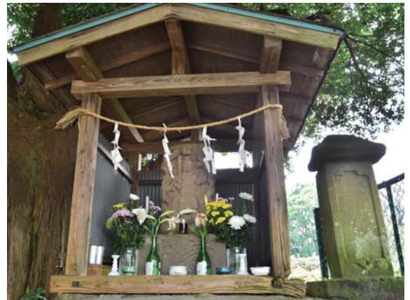
くびづか どうづか 首塚と胴塚

四千人にも及ぶ両軍の死者をどのように葬ったかは伝わっていない。志田道と町道との分岐点の丘の上を昔から首塚といっているが、こうか 弘化2(1845)年に不動尊が建てられてからは不動堂ともよばれるようになった。ほうえい 宝永3(1706)年9月に建てた傍の碑には、当時この辺に戦死者の幽霊が出没するので念仏供養したと刻んである。なお道を隔てた志田沢沿いに胴塚と呼ぶ塚がある。昭和のはじめ小刀一振が出土した。