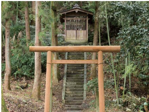
たしろじょうし はちまんしゃ 田代城址と八幡社

田代城は、北条氏の家臣内藤氏の居城で、伝承では三増合戦のとき敵の火矢を受けて焼けおち再建されることはなかったという。しかし、その守護神の八幡社は愛川中学校の裏の丘に、たぶの木に囲まれて昔を今に伝えている。