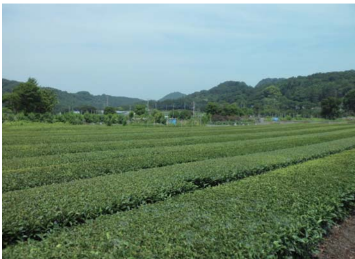
合戦場の一部(現在は茶畑になっている)