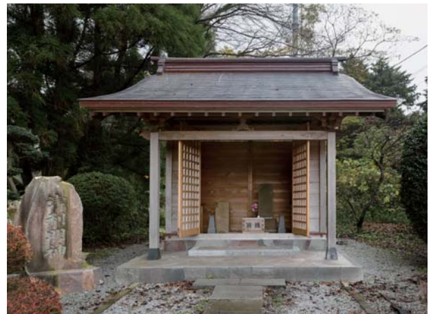
木太刀も奉献されている浅利明神